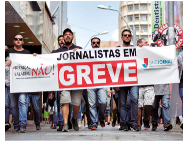
Vitória dos jornalistas

Pesquisadores vão às ruas domingo em defesa da ciência e da educação em SP, RJ e BH. Objetivo é chamar atenção para os ataques do governo.