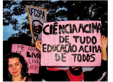
Em defesa da ciência

Pesquisadores vão às ruas domingo em defesa da ciência e da educação em SP, RJ e BH. Objetivo é chamar atenção para os ataques do governo.